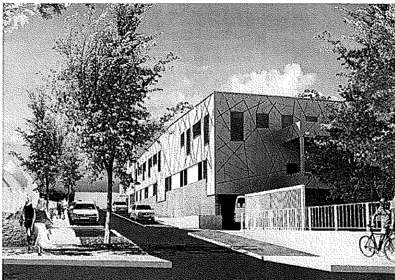
La rénovation engagée inclut une refonte totale des voiries et une nouvelle organisation urbaine

L'Hôtel-Dieu fait peau neuve. Une mue en deux temps, rénovation du bâtiment principal et reconstruction de l'Ehpad via un bailleur social, pour un montant global de 16 M€. Début des travaux dans une semaine, livraison attendue fin 2016 pour la première phase, premier semestre 2017 pour l'Ehpad.