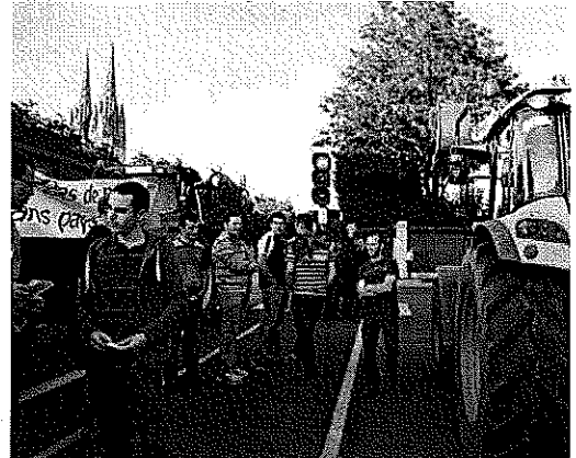
Les agriculteurs se sont déplacés avec une vingtaine de tracteurs, hier soir, place de la Résistance, à Quimper.

Environ 200 agriculteurs se sont rassemblés, hier soir, place de la Résistance, à Quimper. La soirée semblait paisible, mais une épaisse fumée noire en début de soirée, a montré que la situation pouvait être explosive.