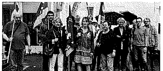
Une délégation d'agents du pôle de Morlaix a manifesté devant le siège de la direction des finances publiques où se tenait un comité technique local sur les restructurations.

« Le service d'enregistrement des actes de Morlaix, assuré par quatre agents, reçoit 2.000 usagers par an. Le pôle de Morlaix a toute son utilité, car il couvre un secteur de plus de soixante communes. Nous restons très attachés à cette notion de service public et les usagers aussi qui